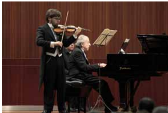
Paul Badura Skoda con Edoardo Zosi

avuto la gioia di conoscerlo personalmente in svariate occasioni sia pubbliche che private, è la sua grande gentilezza d'animo da grande signora, quella urbana sensibilità che risiede nella grande semplicità. Badura-Skoda incarna l'ideale della scuola viennese che si rivela, secondo me, nella misura. Le sue esecuzioni di grandi classici come Mozart, Beethoven e Schubert sono modellate nel rispetto della tradizione. Personalmente trovo il suo Schubert emozionante nell'accezione della trasmissione di un pathos senza mai scendere nella commiserazione e nell'effetto. È stata una gioia riascoltarlo e rivederlo e da questa emozione è nata la riflessione sulla figura del maestro, sia musicalmente, che civilmente.