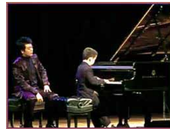
Lang Lang con un giovanissimo pianista