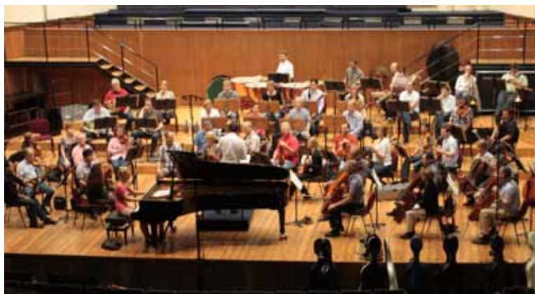
La Philharmonie Südwestfalen durante le prove in Sala Verdi

Per concludere, vorrei ringraziare la vostra organizzazione per la meravigliosa opportunità di esibirci a Milano, il pubblico per l'accoglienza calorosa e competente e tutti voi perchè è stata una positiva e felice occasione di crescita per la nostra orchestra.